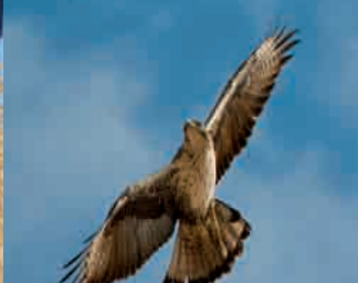
Águila-azor perdicera, "La reina del cortado" Bonelli's Eagle, "The most threatened"