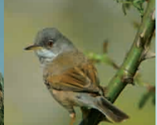
Curruca tomillera, "El duende del matorral" Spectacled Warbler, "The scrub elf"