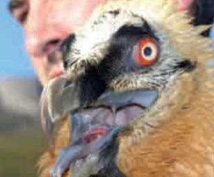
Quebrantahuesos, "el reintroducido" Bearded Vulture, "the reintroduced"