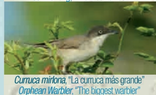
Curruca mirtona, "La curruca más grande" Orphean Warbler, "The biggest warbler"