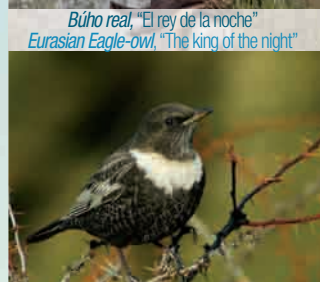
Mirlo capiblanco, "El de invierno" Ring Ouzel, "The wintering"