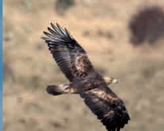
Águila real, "La reina" Golden Eagle, "The queen"