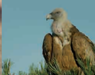
Buitre leonado, "El carroñero" Griffon Vulture, "The scavenger"